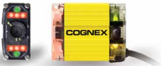
64 % skutečné velikosti