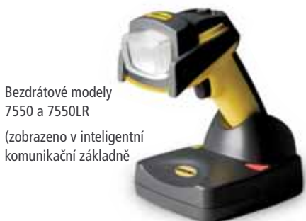
Bezdrátové modely 7550 a 7550LR (zobrazeno v inteligentní komunikační základně)

Tyto modely identifikují a sledují součásti, které mají kódy nejnáročnější na čtení.