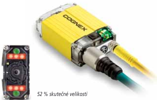
52 % skutečné velikosti