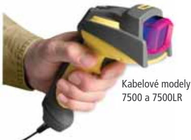
Kabelové modely 7500 a 7500LR