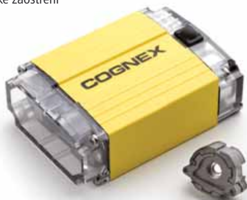
73 % skutečné velikosti